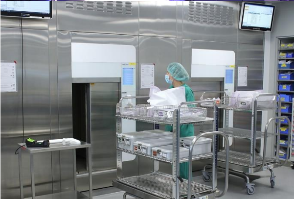
Impressionen aus dem Neubau im Uhrzeigersinn: OP-Saal, Aufwachraum, ZSVA