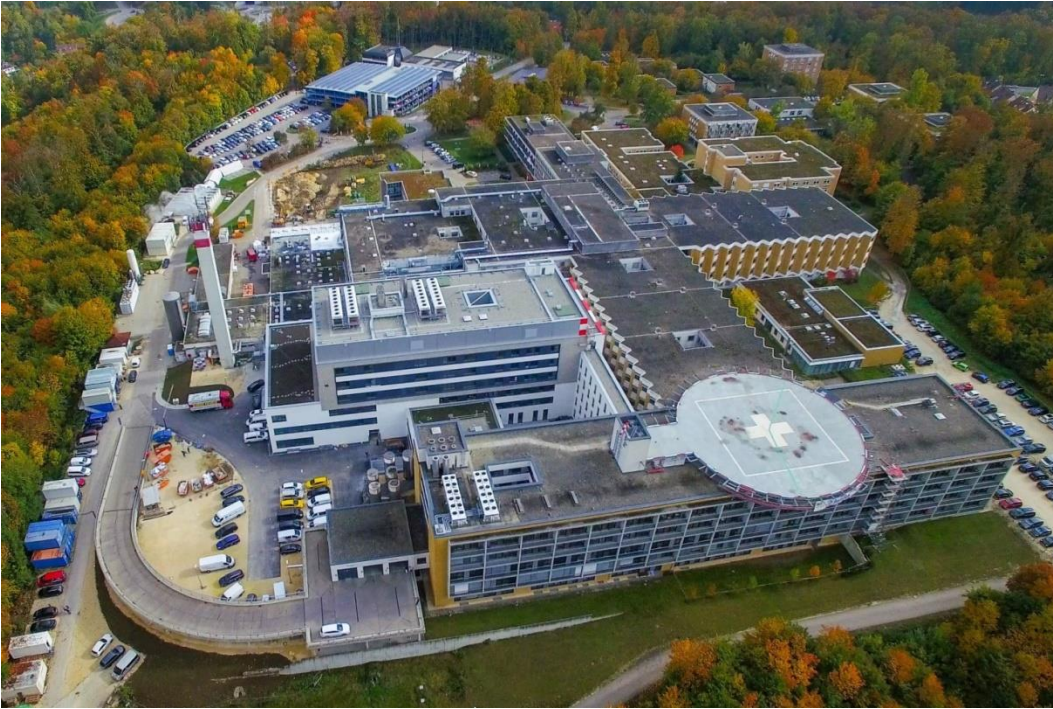
Der achtgeschossige Neubau Haus K (Bildmitte) überragt die bisherigen Klinikgebäude.